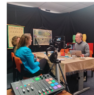
Opname podcast (Tjipcast)