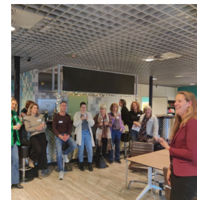
Nieuwjaarsborrel en reflectiemiddag