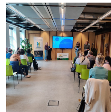
Informatiebijeenkomst Gemeente Den Haag