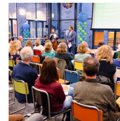
Jaarevent Project OA maken we samen